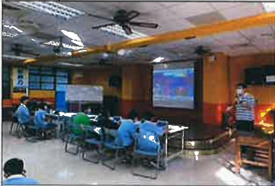
進行分組雙語擂台賽