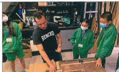
百工職場木工體驗