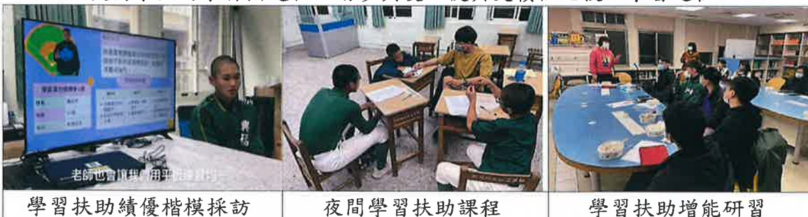
學習扶助績優楷模採訪