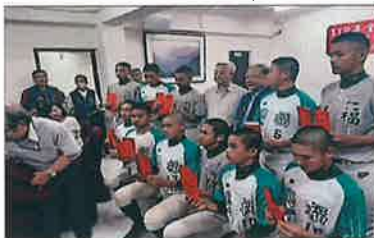
福興宮頒發優秀獎勵金