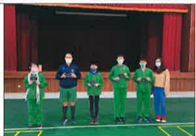
點數兌換期末抽獎