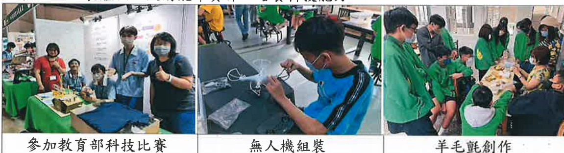
參加教育部科技比賽