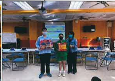
教務主任獎勵優良學生