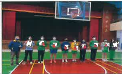
家長會頒發段考進步獎