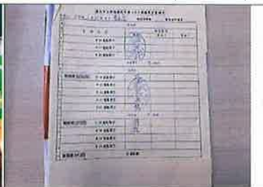
英雜單字背誦認證