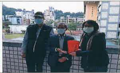
福興宮頒發獎助金