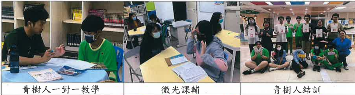
青樹人一對一教學