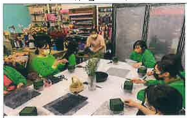
百工職場「花日記」體驗