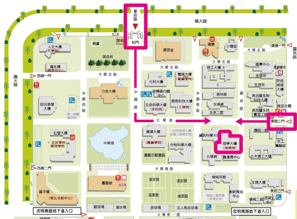
▲中興大學校園平面配置圖