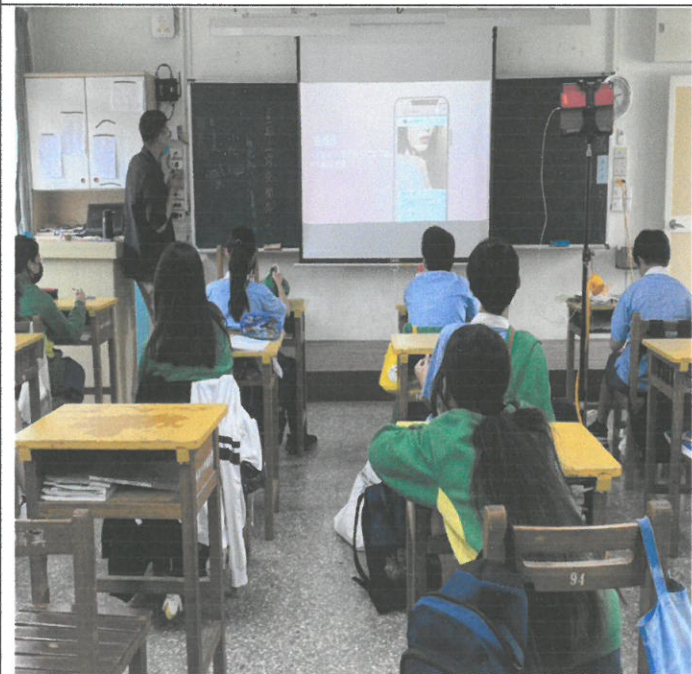
圖說：介紹哪些情形是性剝削。