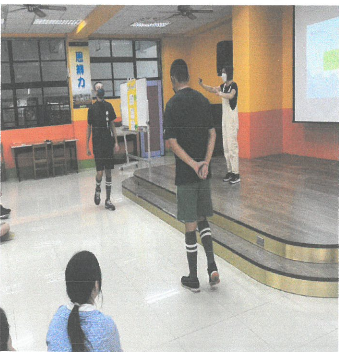
圖說：講師請學生上台示範。