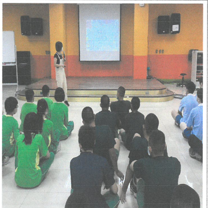
圖說：講師分享自身經驗。