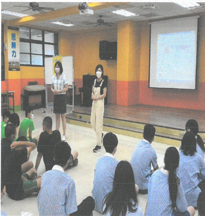
圖說：組長介紹講師。