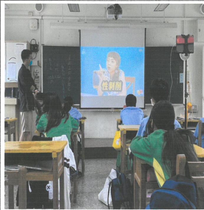
圖說：播放性剝削宣導影片。