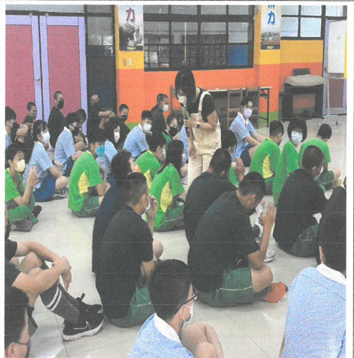
圖說：講師跟學生互動。